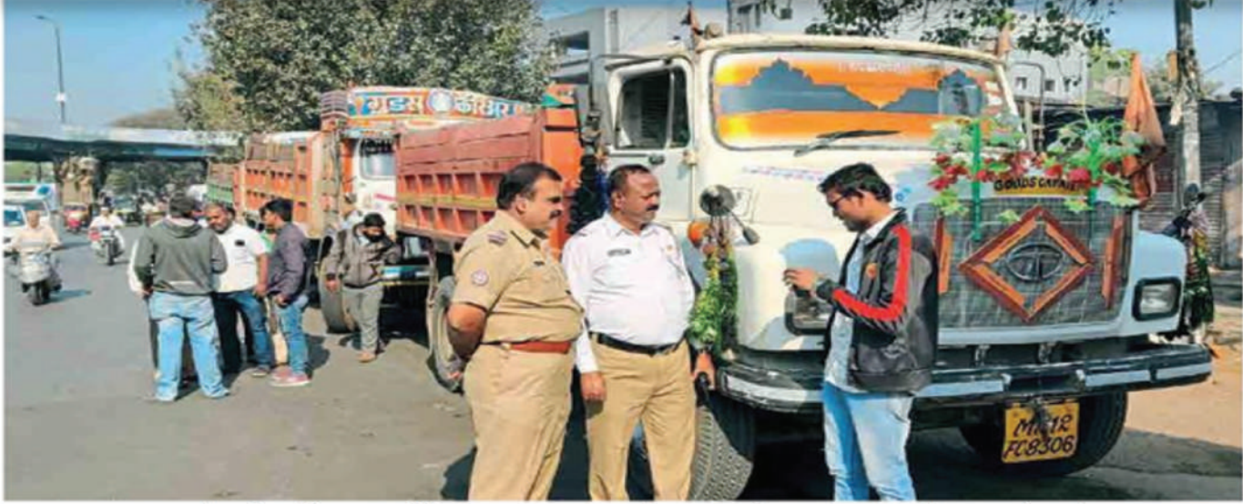
हडपसर : अवजड वाहनांना प्रवेश बंदी असतानाही नियम न पाळणाऱ्या वाहनांवर वाहतूक विभागाकडून कारवाई करण्यात येत आहे.