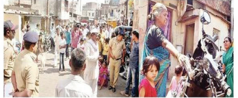
वाहनांच्या तोडफोडीच्या घटनेनंतर पोलिसांनी घटनास्थळी पाहणी केली. त्यानंतर आता कारवाईला वेग आला आहे.