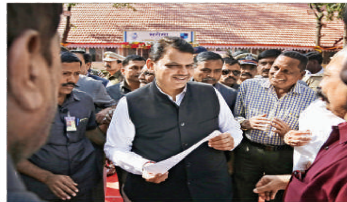
ALL SMILES: State Chief Minister Devendra Fadnis (C) had inaugurated the Bharosa Cell in Pune on January 9 this year.

This has increased our responsibility to perform well," he added.