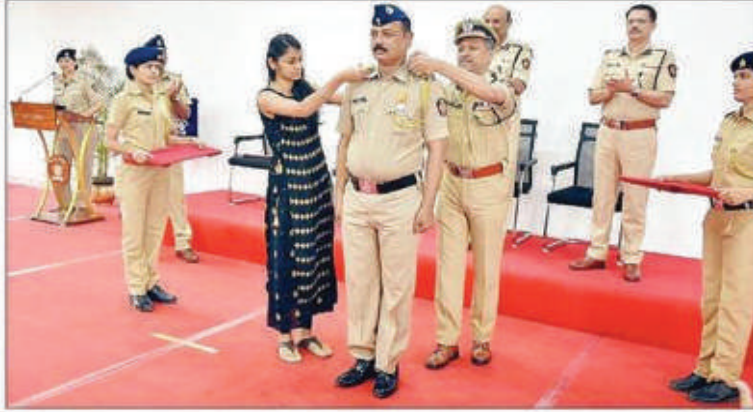
पुणे पोलिस दलातील कर्मचाऱ्याला फीत लावताना कुटुंबीय व पोलिस आयुक्त व्यंकटेशम.