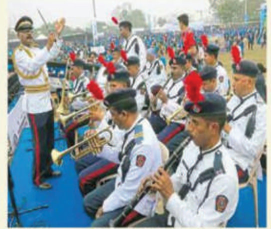
स्पर्धकांचा उत्साह वाढविण्यासाठी विविध देशभक्तीपर गीते सादर करताना पुणे पोलिसांचे बॅंडपथक.