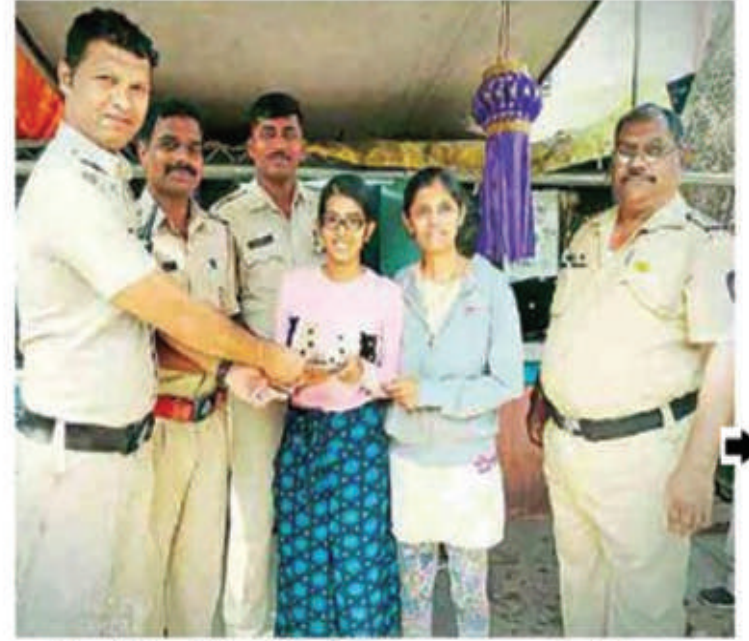
वारजे : चोरीला गेलेला मोबाईल परत करताना वारजे पोलिस.