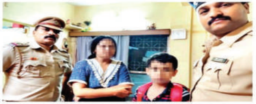
The minor after being reunited with his mother by Vishrantwadi police

According to police, on Thursday night, the minor's mother had chastised him for his poor academic show and asked him to improve his performance. The child, however, took the scolding to his heart and decided to flee from his home. Around midnight when everyone else was fast asleep, the minor sneaked out through the main door of the house. Once outside, the child hired an autorickshaw to go to Shivajinagar bus stand. He had planned to take a bus from the depot to go to his grandparents' place. Police patrolling the streets spotted the boy near Bremen Chowk in Aundh In an auto and gestured to the driver to stop. When the driver did not halt, the cops fol-