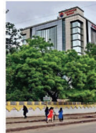
Cosmos Bank reported a malware attack in August 2018