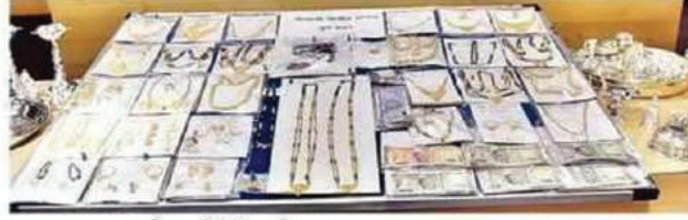
जप्त करण्यात आलेला चोरीतील मुद्देमाल