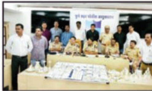
Police at the press meet on Tuesday informing about the arrests