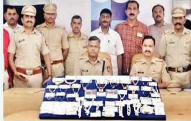
पोलिसांनी जप्त केलेला चोरीच्या गुन्ह्यातील मुद्देमाल व गुन्हे शाखेचे पथक.

तिघांच्या ताब्यातून ४७ तोळे सोन्याचे दागिने, चार किलो चांदी, कार, मोटारसायकल, हत्यारे, कटावणी असा तब्बल २३ लाख सत्तावीस हजारांचा मुद्देमाल हस्तगत करण्यात आला आहे.